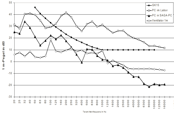
Bild 1 : Pegeldifferenz zwischen geöffnetem und geschlossenem Gehäuse