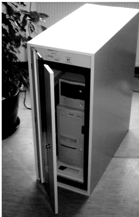
Bild1 : SAGA PC XL

DBGM geschützt - technische Daten und Ausführung können ohne Ankündigung geändert werden